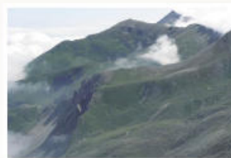
Alto Visone della Gianna