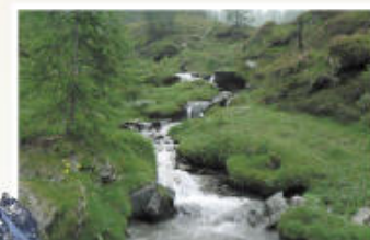
Salendo al Colle della Gianna